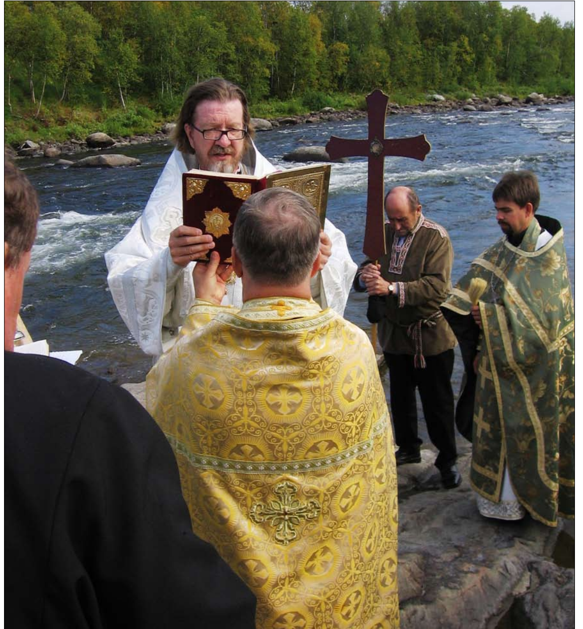
Vedenpyhitykseen kuljettiin Näätämöjoen kosken rantakalliolle. (Kuva oik.)