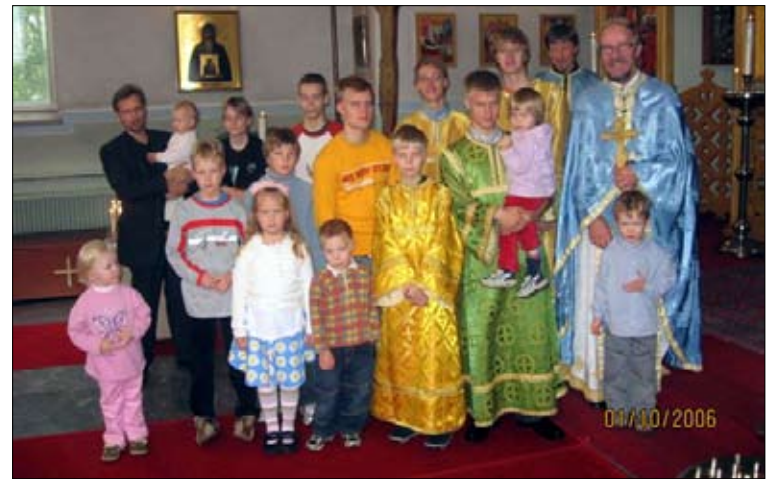
Nuorisotyötoimikuntalaisia voi ottaa hihasta tai nykäistä vaikkapa kaavusta, jos on jokin hyvä idea toteutettavaksi.

Näitä asioita mietin, kun käynnistämme Mikkelin seurakunnassa nuorisotoimikuntaa. Meillä Mikkelissä on jo vuosia toiminut lapsille