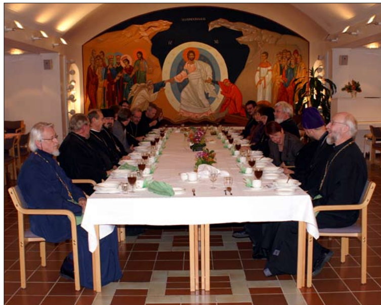
Hiippakuntaneuvoston lokakuussa Kuopiossa oli 25 kokousedustajaa.