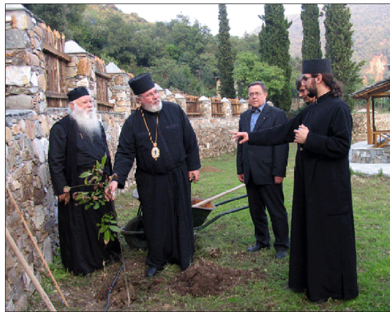
Arkkipiispa Leo ja arkkipiispa Jukka Paarma vierailivat Pyhällä Athosvuorella. Kuvassa he istuttavan pähkinäpuun tainta.

Pyhän Vuoren luostareissa tapasimme useimmat niistä veljistä, jotka olivat näyttelyn avajaisien tiimoilta maassamme. He olivat hyvin vaikuttuneita kokemuksestaan. Toiset