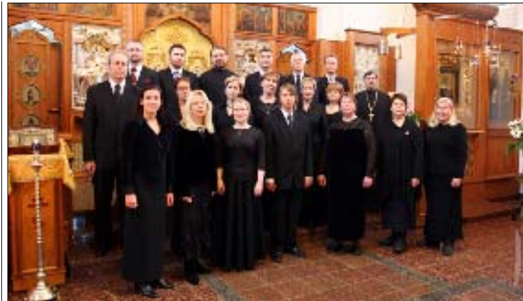
Kamarikuoro Krysostomos äänitti ensimmäisen levynsä Uuden Valamon luostarissa lokakuun alussa.