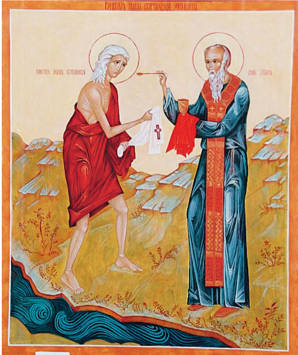
Pyhittäjä-äiti Maria Egyptiläinen (500-luku) on täydellisen kääntymyksen, palavan uskon, tinkimättömän paaston ja esikuva. hänen muistopäiväänsä vietetään suuren paaston 5. sunnuntaina. Ikoni Oulun Pyhän Kolminaisuuden katedraalissa.

Millainen paastonaika olisi otollinen Jumalalle? Miten tavallinen yhteisön jäsen sen kokee ja uskoo? Olisiko Jumalalle mieleen syvällinen ajattelu vai toiminta? Kenties molemmat.