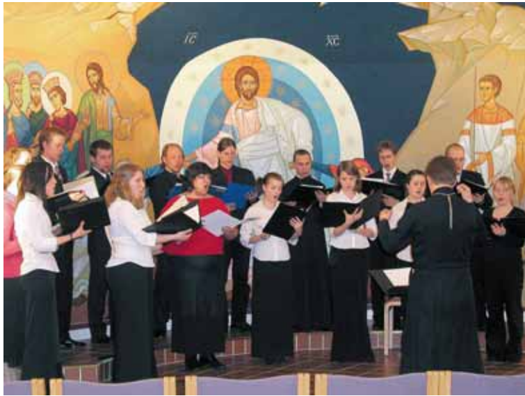
Kaksi nuorisokuoroa piti yhteiskonsertin Kuopion ortodoksisessa seurakunnassa.