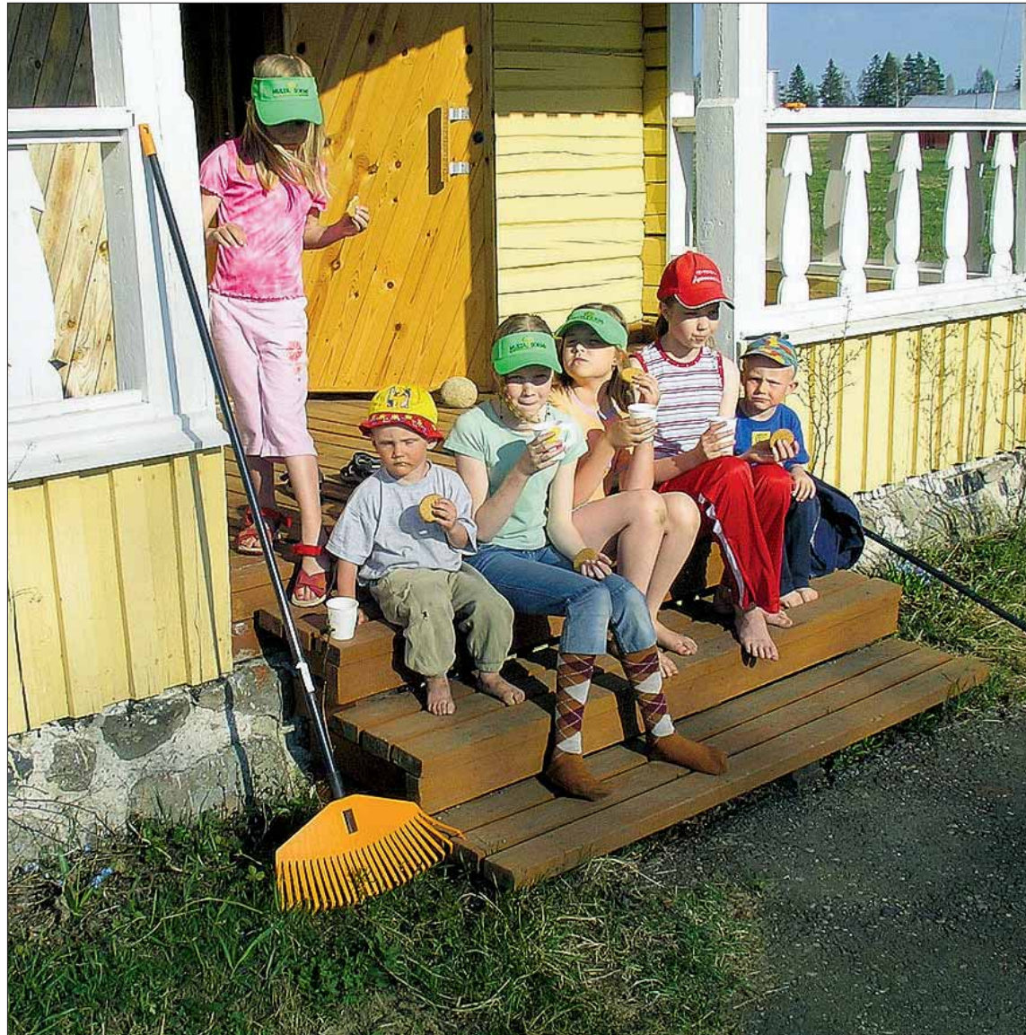
Alapitkän talkoissa oli mukana runsaasti nuorta väkeä.