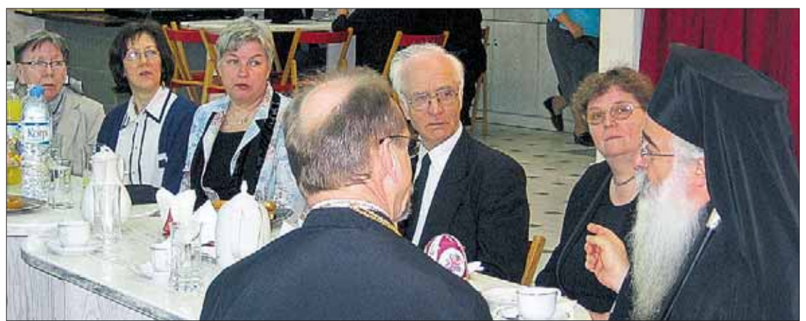
Kreikan pyhiinvaeltajat matkan päätösaterialla Pireuksen seurakunnassaa

Pyhiinvaellusmatkat suuntau- tuvat pääsääntöisesti luostareihin. Toki ohjelmaan on hyvä sisällyttää muutakin aktiviteettia. Voidaan käydä tutustumassa toisten seur- akuntien kirkkoihin, hautausmaihin, sopii katsella myös museoita ja näyttelyjä, ehkä joku konsertti tai teatteriesitys osuu sopivasti matkan varrelle. Kenties käynti kylpylässä parantelee kipeytyneitä jäseniä ja auttaa entistä virkeämpänä seisomaan myös jumalanpalveluksissa. Keskeisintä on kuitenkin se, että kun lähdemme liikkeelle uskovan kan- sana, niin ohjelmaan sisältyy myös jumalanpalveluksia ja hengellisiä