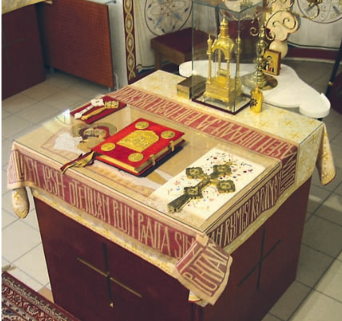
Oulun Pyhän Kolminaisuuden katedraalin alttaripöytä.

tuntee ihmisyyden syvimmän äänen: pyhyiden, palvonnan ja rukouksen todellisuuden. Uskontososiologit puhuvat myös siitä valtavasta murroksesta, joka tapahtui tuolloin Moorian vuorella, kun primitiivisten, verenhimoisten ja loputtomia nais- ja lapsiuhreja vaatineet julmat jumalakuvat alkavat muuttua syvemmin humaaneiksi.