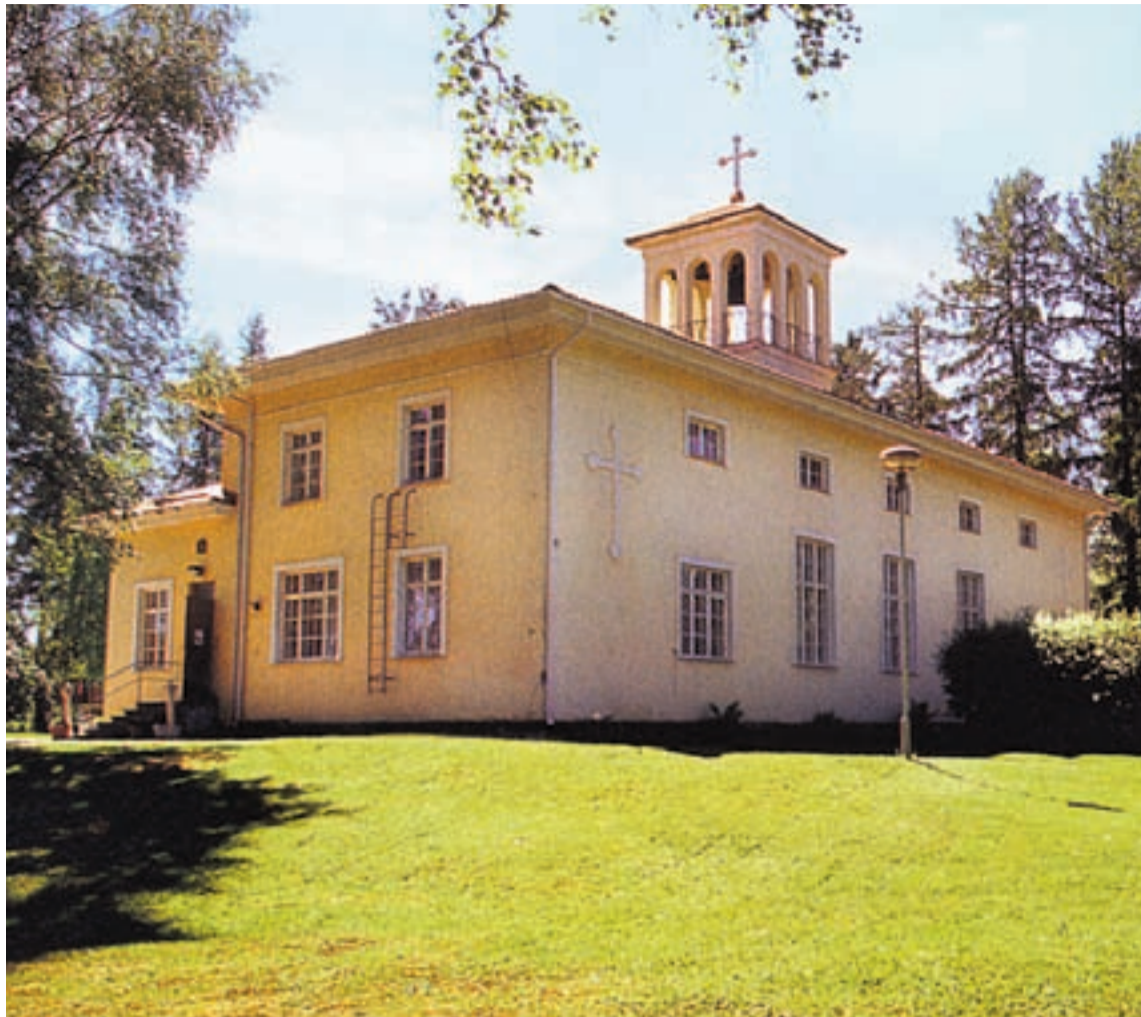
Kiuruveden pyhän Nikolaoksen kirkko on ollut vuosikymmenten ajan paikallisen tiistaiseuran hengellinen koti ja kokoontumispaikka.