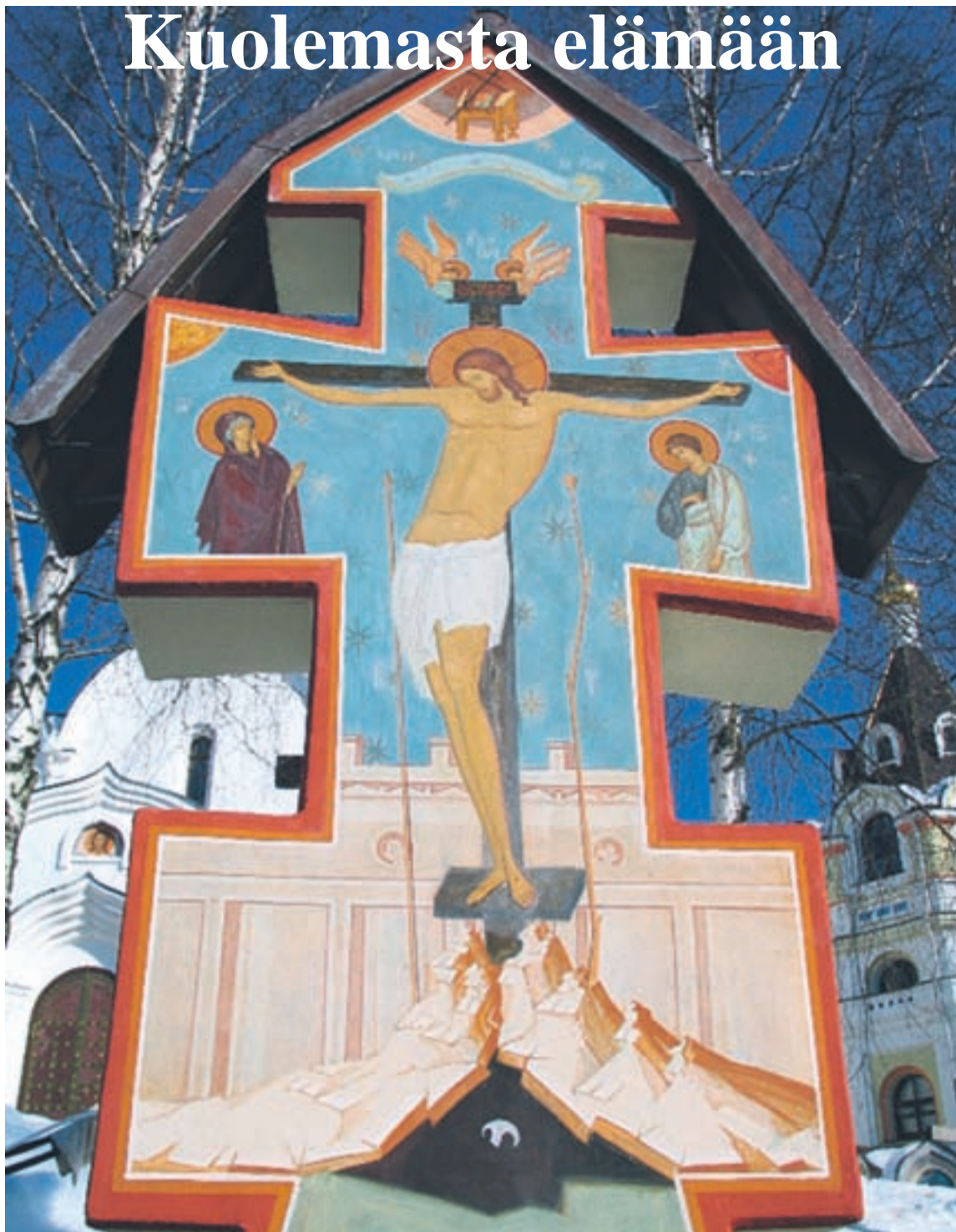
Ristiinnaulittu kunnian kuningas. Pyhän Elisabetin luostari, Minsk, Valko-Venäjä.

rukouksemme merkki. Sielun kuolemattomuuden uskon totuuteen perustuen on pyhä kirkko jo kahden vuosituhannen ajan kehottanut omaisia ja ystäviä muistamaan rukouksessa rakkaita vainajia. Rakkauden tähden tapahtuva edesmenneiden rukouksellinen muistaminen antaa myös meille surussamme lohdutusta. Tämä tuo meille itsellemmekin läheiseksi kuoleman jälkeisen olevaisuuden, jota kohti me kilvoitellen väijäämättä matkaamme.