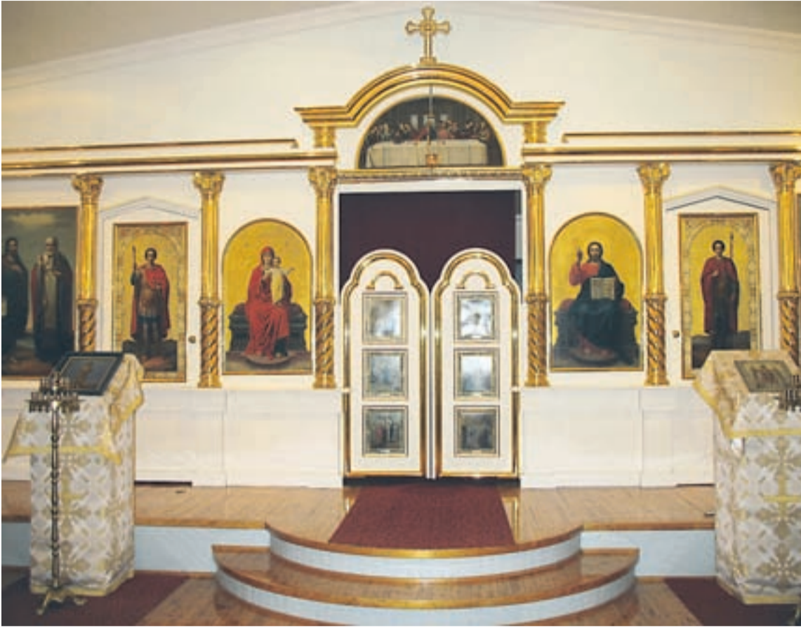
Karjalan valistajien kirkon uusittu ikonostaasi.