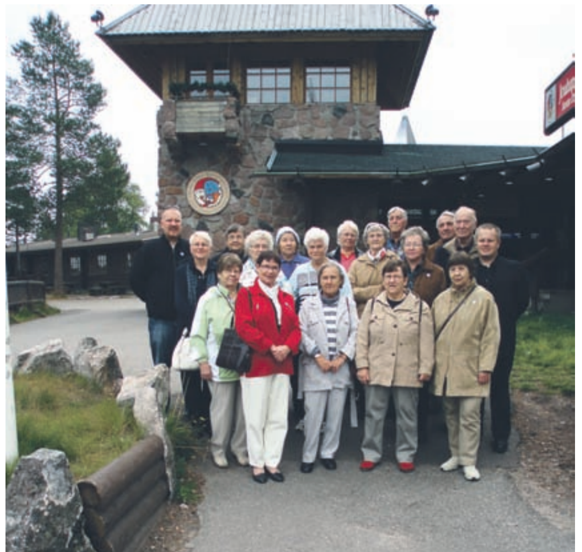
Kuvassa 25.-27. elokuuta 2008 Oulun seurakunnan järjestämän seniorien virkistysleirin osallistujat napapiirillä. Lämmin kiitos Lapin seurakunnalle ja erityisesti Rovaniemen tiistaiseuralle vieraanvaraisuudesta.