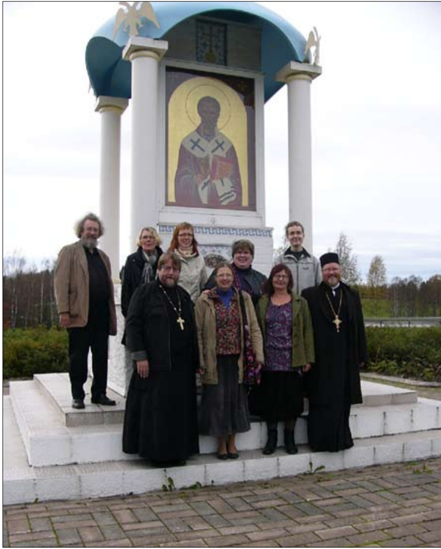
Jyväskyläläiset Kiuruveden-retkeläiset paljastautuivatkin kiuruvetisiksi.