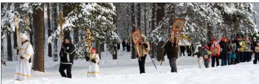
Teofaniaa, Kristuksen kastejuhlaa vietämme 6.1.2012.