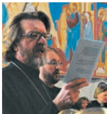
Metropoliitta Panteleimon ekumeenisen neuvoston kokouksen kuorossa.

Kokoukseen osallistui noin 50 edustajaa kahdestatoista Suomen kristillisestä kirkosta tai kristillisestä yhteisöstä. Neuvostoon kuuluu lisäksi tarkkailijajäseniä 20 kristillisestä kirkosta tai yhteisöstä.