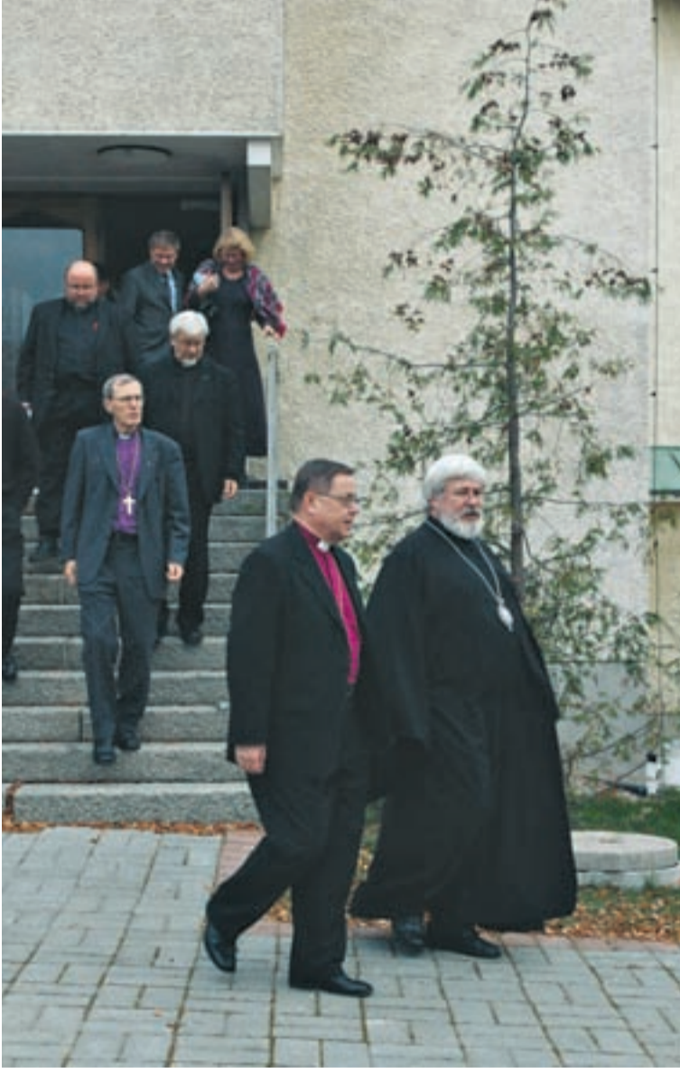
Arkkiepiispa Jukka Paarma ja arkkiepiispa Leo astelivat keskustellen Pyhän Eliaan kirkosta Evakkokeskukseen.

yhteisöjen johtajat saattoivat nähdä evakkokeskuksen ja myös kirkkomme, jossa on ikonitaide hyvin esillä. Kokous toi välähdyksen lisäksi seurakunnan ja kaupungin välisestä mutkattomasti toimivasta suhteesta, KP arkkiepiispa Leo sanoi.