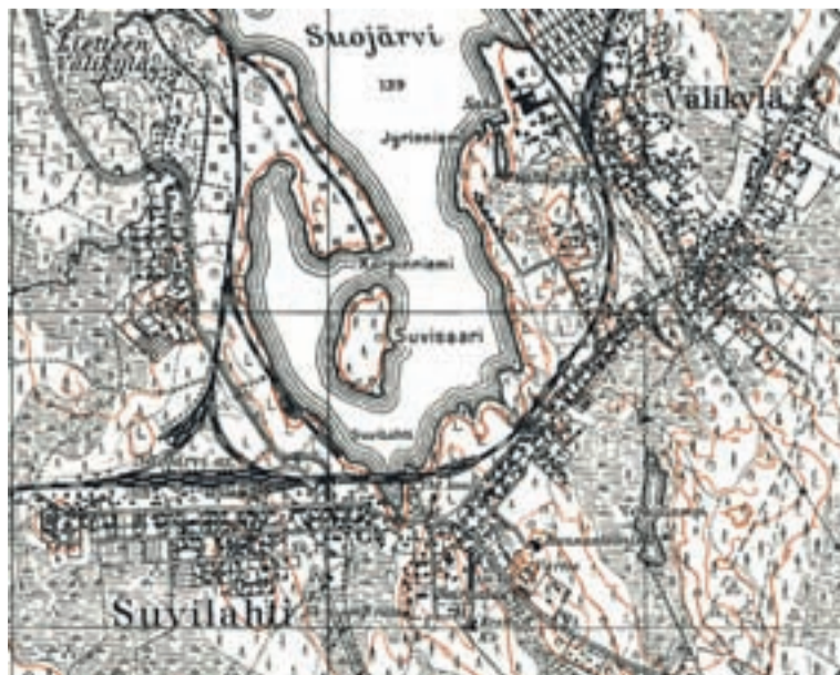
Kartat Maanmittauslaitos kopiointi keitelty.

Jyväskylän seudun suojärveläisten illassa to 23.02. klo 18 on esitelmä vanhassa salissa: