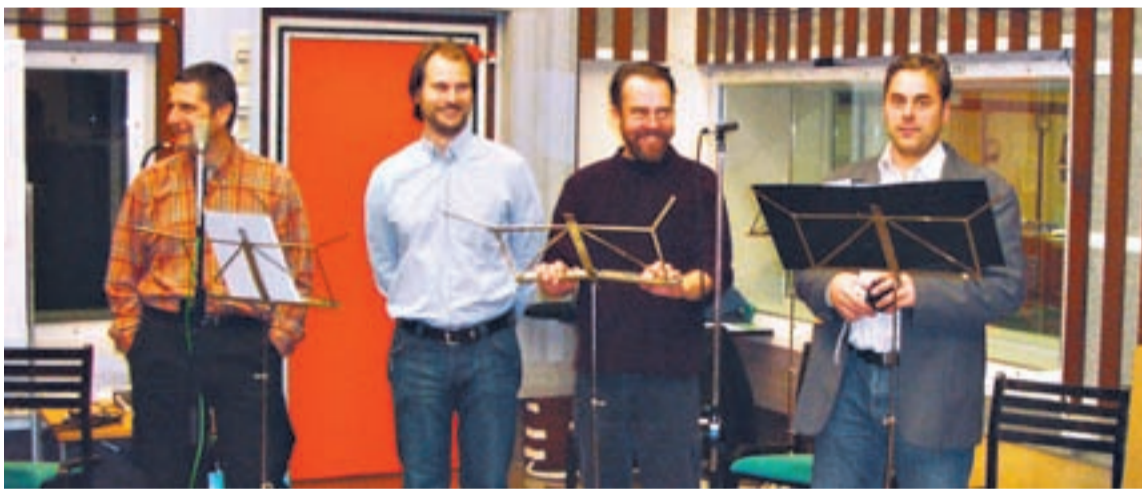
Pyhän Nikolaoksen katedraalikuoron kuoromiehiä levytyspuuhissa. Näitä bassoja naurattaa.