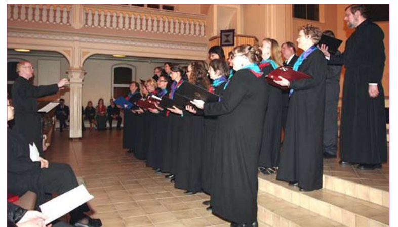
Ortodoksiset kirkkolaulut soivat milloin hentoina, milloin vahvoina ja hartaina ylistyslauluina.