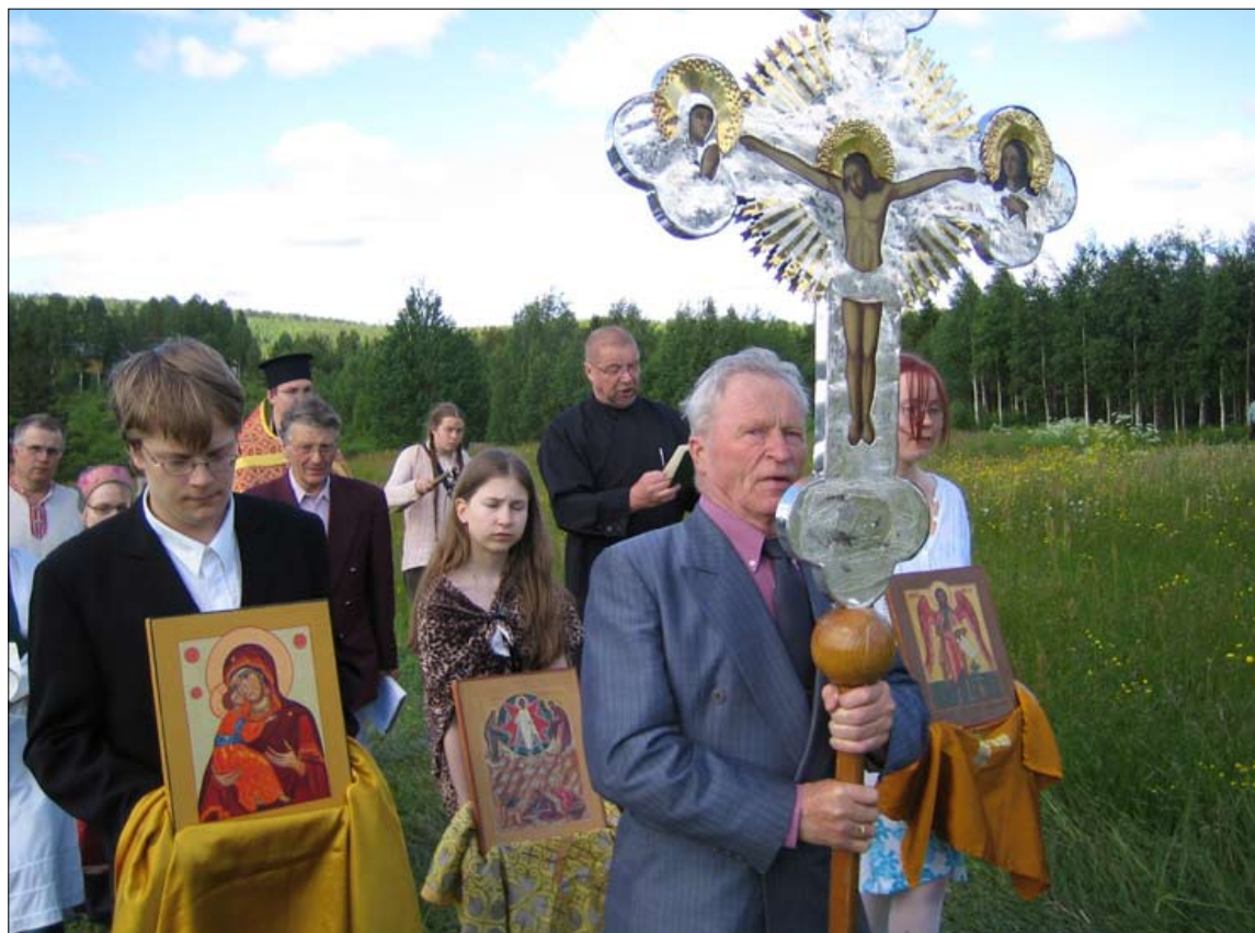
Valtimon Rasimäki on prosentuaalisesti Suomen ortodoksinen kylä. Rasimäelle kannattaa matkustaa Johannes Kastajan praasniekkaan ensi kesänä.

Lisätietoja juhlasta ja majoituksesta yms, Nurmeksien ortodoksisesta seurakunnasta, khra Andrei Verikov 040-7458258.