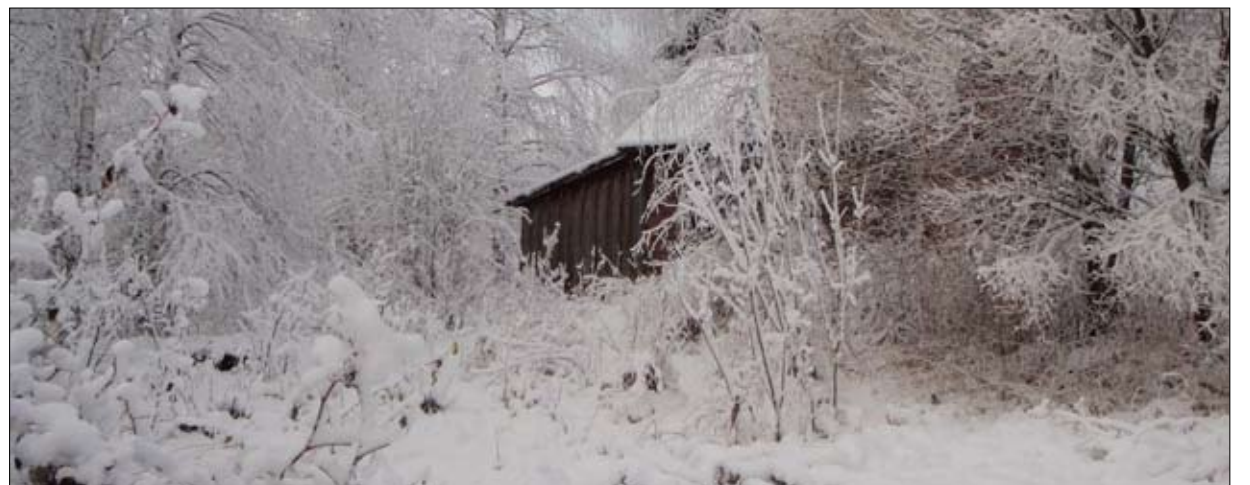
"Herran katse yltää kaikkialle, sen alla ovat sekä hyvät että pahat." (Sanalaskujen kirja 15:3, Raamattu VT)