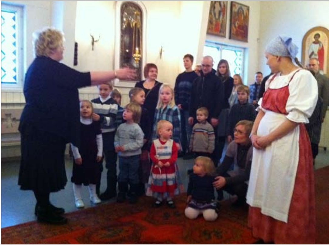
Aina kun lapsia on vähänkin kirkossa paikalla, kanttori laulattaa heillä Herran rukouksen.