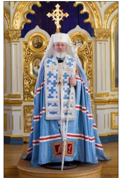
Joulupaasto päättyi Kristuksen syntymän juhlaan 25.12.