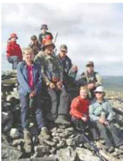
Vaeltajan oli helppo lumoutua Lemmenjoesta.

Kuutosseurakunnat järjestivät kolmatta kertaa kesävaelluksen Lappiin. Vaellus suuntautui Lemmenjoelle ja kesti viikon heinäkuun lopulla.