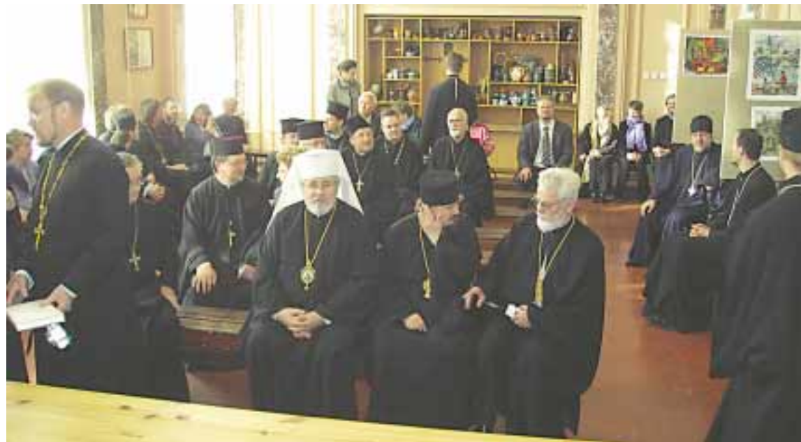
Sortavalassa ei varmaankaan usein ole ollut niin runsasta ortodoksispappien joukkoa kuin oli nyt.