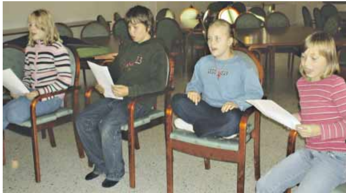
Asteris-kuoro toivoo mukaan lisää laulajia.