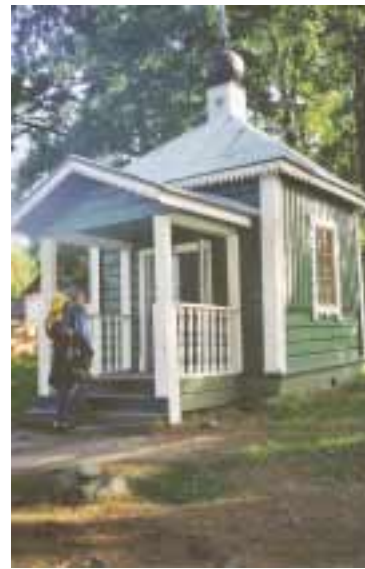
Tie - uuden alku.