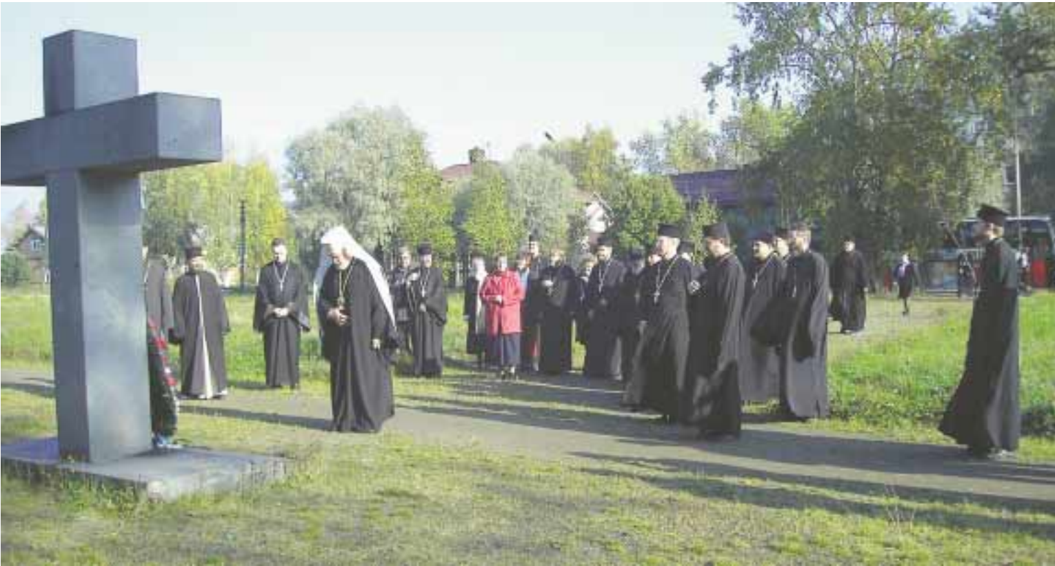
Ortodoksisen Pappien Liiton väen Sortavalan-vierailuun kuului myös käynti sankarihaudoilla.