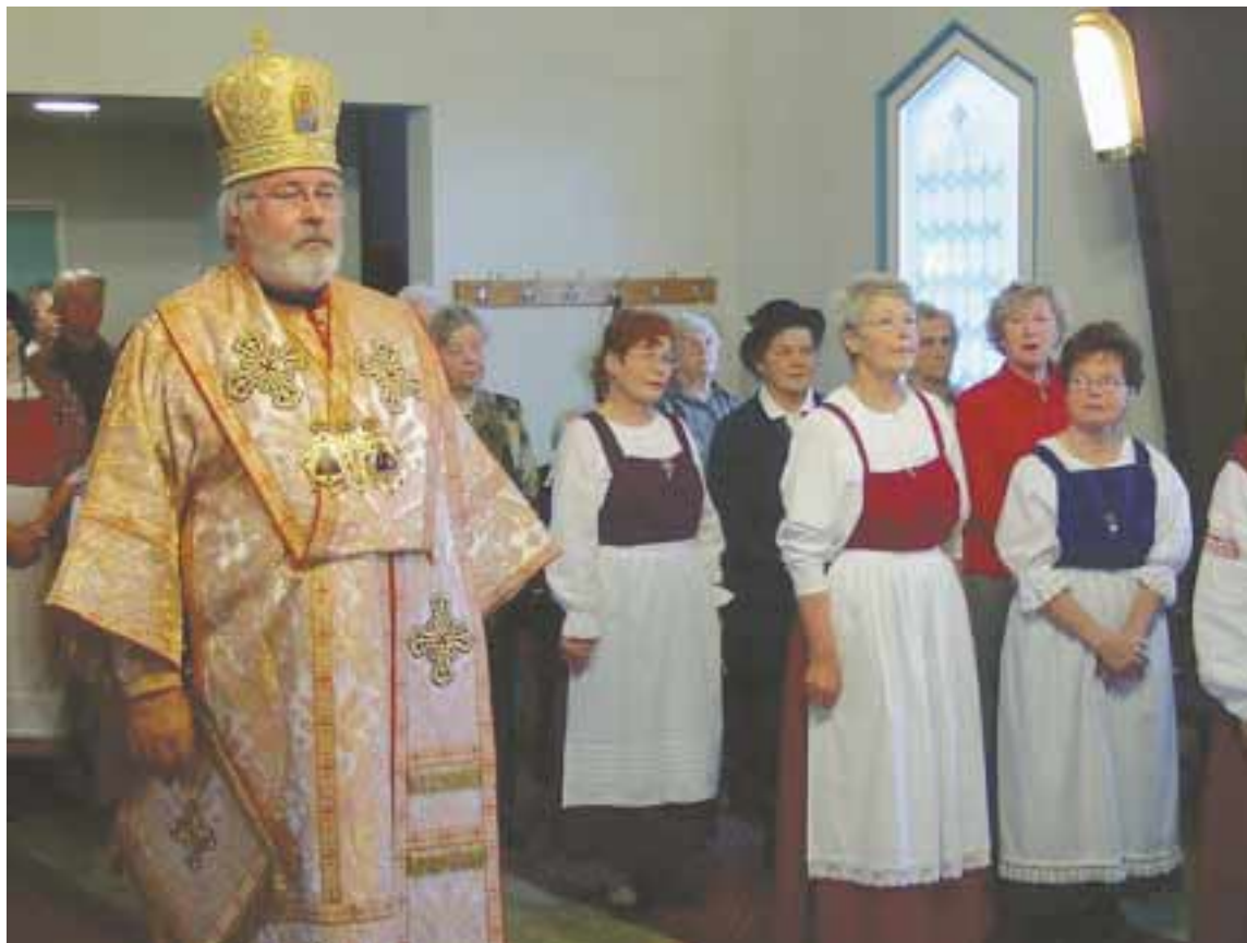
Suonenjoen Karjala-Seura ry vietti näkyvästi 60-vuotisjuhlaansa Suonenjoella 2.10. Juhla alkoi liturgialla jonka toimitti KP arkkipiispa Leo. Päiväjuhla oli rakennettu näytelmämuotoon ja moni katsoja löysi palan omaan historiaansa. Kirkkokunnan tervehdyksen juhlaan toi arkkipiispa Leo.