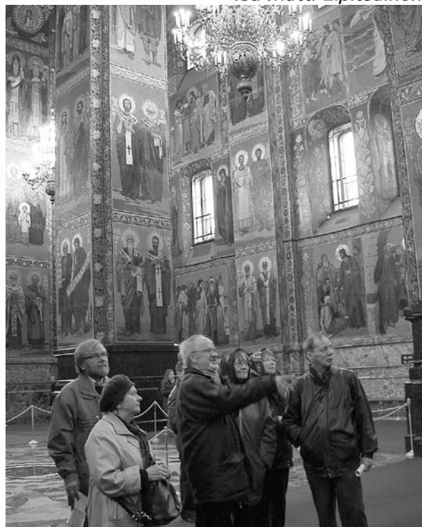
Yllä: Matkalaiset tutustumassa "Verikirkon" upeisiin mosaiikki-ikoneihin