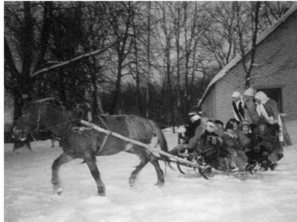
Hevosajelu kuuluu jouluun

Illan suussa isä toi poikien kanssa kuusen joka ulottui kattoon. Koristeina olivat oikeat kynttiät. Illan pimetessä kävimme haudalla viemässä kynttilät. Kaikkein komein hauta oli erään Hagertin perheen. Kaikkia kynttilöitä ei voinut edes laskea. Se oli nähtävyyks. Illalla siivottuamme tuvan ja käytyämme saunassa, puimme parhaat vaatteet pällemme. Ruoka syötiin mutta lapsena se oli pakollinen kuvio, koska pukki ei tulisi ennen. Kiltteystäkään ei voinut olla täysin varma. Joulupukki ei ollut punapukuinen vaan ruma käännettyine lampaan turkkeineen. Pelkäsinkin kovasti ja ääni vapisten luin rukoukset jotka piti. Onneksi pukki poistui aika nopeasti