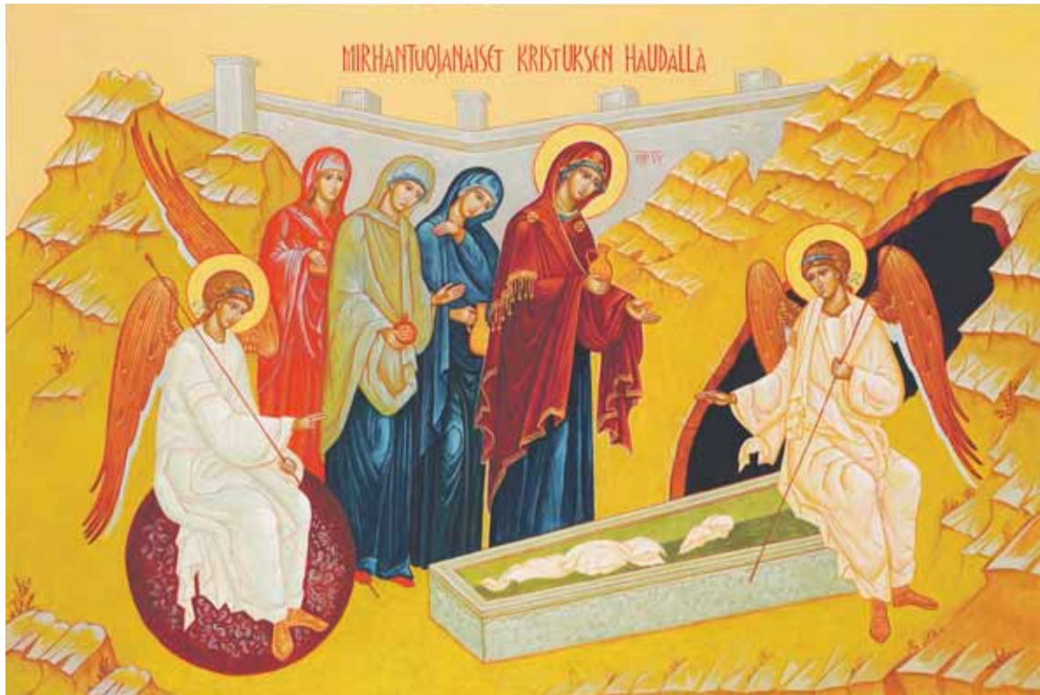
Mirhantuojanaiset Kristuksen haudalla. Oulun katedraalin ikoni.

В седьмой день, читаем далее в Библии, Бог почил от всех Дел Своих. И Бог благословил седьмой день, и освятил его. Перед праздником Пасхи, в Великую Субботу,