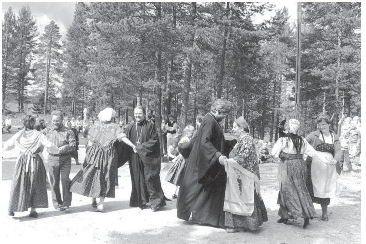
Juhlailoa Kuivajärven praasniekassa.