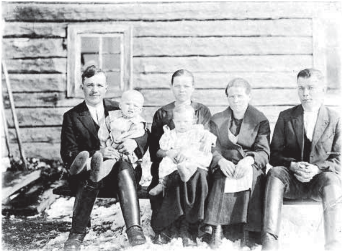
Huosiosvaaran väkeä 1930-luvulla.

synnytyshetkensä alkoi. No, Toarie ei moisesta säikähtänyt. Hän synnytti lapsen ja kietaisi sen esiliinaansa. Käärön hän asetti kivirauzion päälle ja kynti pellon loppuun. Sitten hän lähti kääröineen kotiin. Siellä hän lämmitti saunan ja vei sinne lapsensa lämpimään. Toarie kuoli vuonna 1861 ja oli tuolloin satayksi vuotta.