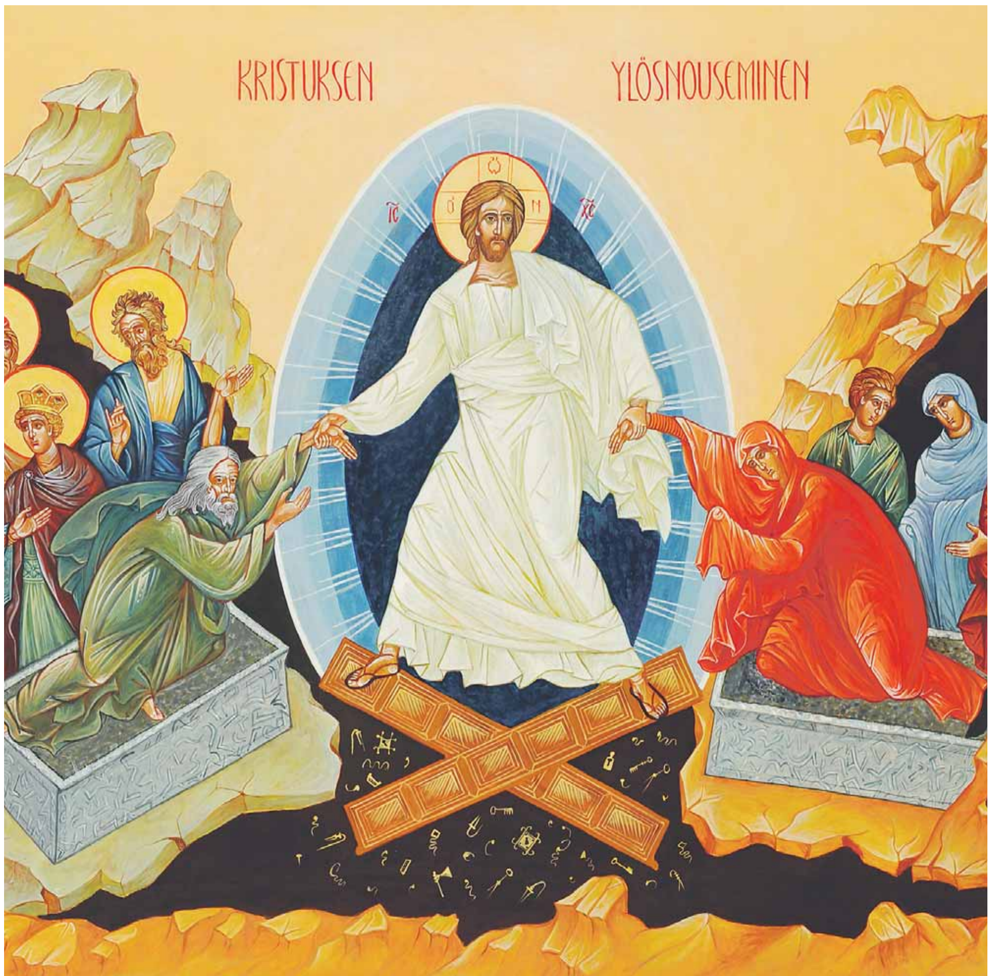
Kristuksen ylösnouseminen. Oululaisten ikonmaalareiden maalaama ikoni on Pyhän Kolminaisuuden ja pyhittäjä Trifon Petsamolaisen kirkossa Inarin Nellimissä.