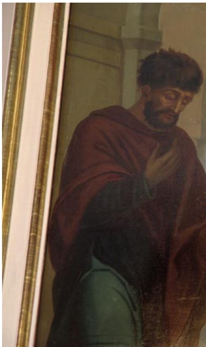
Fariseus ja publikaani Joensuun pyhän Ni- kolaoksen kirkossa.

Pyhän Johanneksen ja pyhittäjä Si- meonin opetukset ovat ajankohtaisia. Suo- malainen yhteiskunta on muuttunut aikai- sempää eriarvoisemmaksi. Tämä vaikuttaa erityisen kipeästi lapsiin ja nuoriin. Asian-