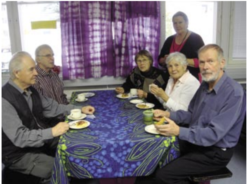
Ensimmäiset asiakkaat. Kerholaiset kahvin ääressä.

Kahviossa tullaan järjestämään teema- ja muita tapahtumia. Kerran kuukaudessa on rukouspalvelus. Joulun alla myyjäiset, joihin nyt alamme askarrella yhdessä. Parittomina viikkoina on kerhossa alustus eri aiheista (katso edempänä ohjelma). Jo-