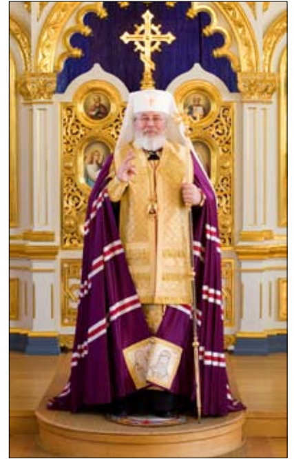
Apostolien paasto alkaa 31. toukokuuta ja kestää 29. kesäkuuta asti. Paaston liturginen väri on violetti.

”Totisesti, totisesti: jos ihminen ei synny vedestä ja Hengestä, hän ei pääse Jumalan valtakuntaan. Mikä on syntynyt lihasta, on lihaa, mikä on syntynyt Hengestä, on henkeä. Älä kummeksu sitä, että sanoin sinulle: ”Teidän täytyy syntyä uudesti.” Tuuli puhalttaa missä tahtoo. Sinä kuulet sen huminan, mutta et tiedä, mistä se tulee ja minne se menee.