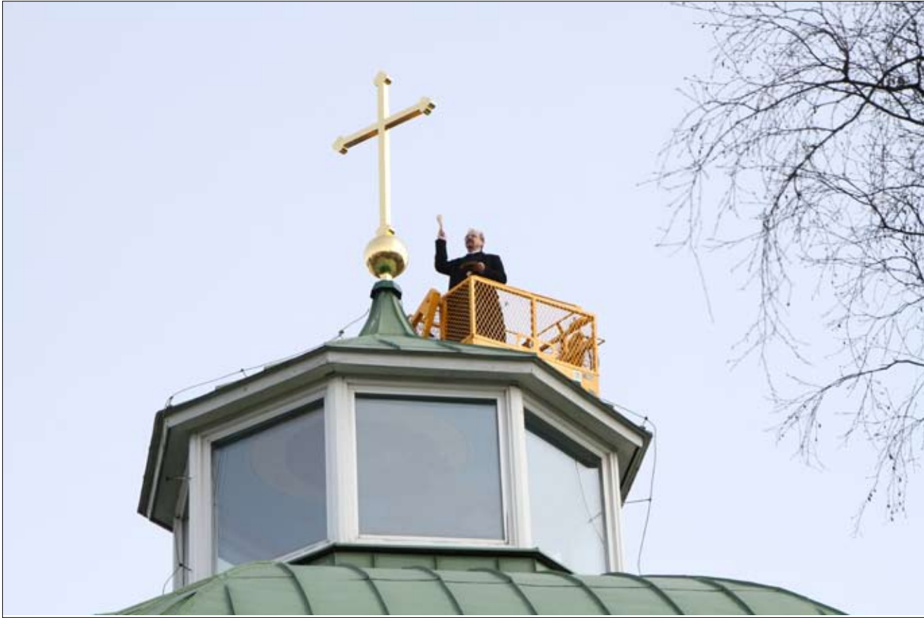
Iisalmen Pr. Elian kirkon keskuskupolin risti uusittiin keväällä 2010. Ristin siunasi isä Elias. Jälleenrakennuskauden pyhäkköjen ristit ruostuvat tai lahoavat. Monien pyhäkköjen ristit kaipaavat uudistamista. Kehy-paja Iisalmessa valmistaa kohtuuhintaisia ristejä myös vähävaraisille seurakunnille.