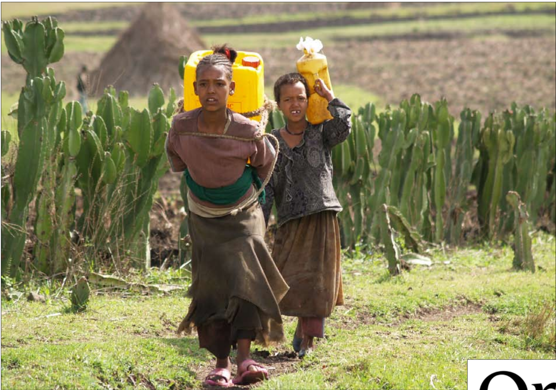
Etiopiassa naisten mahdollisuuksia rajoittaa koulutuksen ja puhtaan juomaveden puute. Köyhillä perheillä ei ole varaa lähettää kaikkia lapsia kouluun, ja silloin tyttäret jäävät kotiin auttamaan kotitöissä.

Jumalanäidin kuolonuneen nukkumisen temppelijuhlaa vietetään kuutosten alueella ainakin Sonkajärvellä Iisalmen seurakunnassa ja Äänekoskella Jyväskylän seurakunnassa.