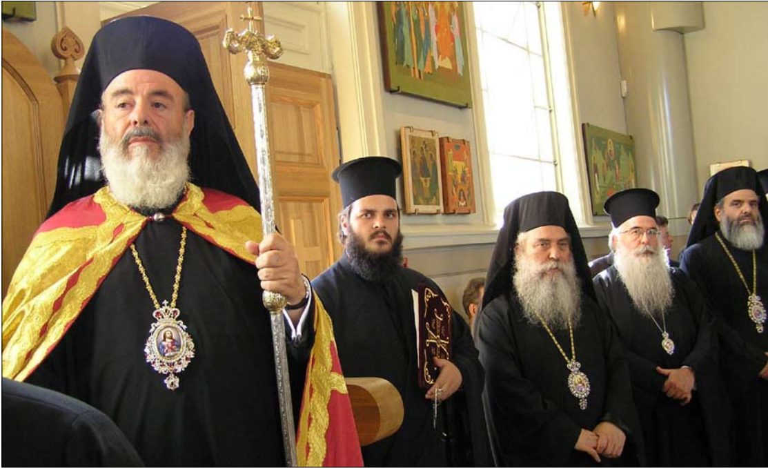
Ateenan ja Kreikan arkkipiispa Kristodulos luonnehti ortodoksista kirkkoa tarpeelliseksi Euroopan kansojen nousevana toivona.