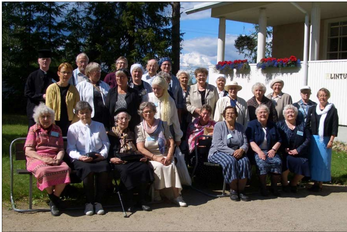
Kultaisen iän leiriläiset yhteiskuvassa Lintulan luostarin pihamaalla.