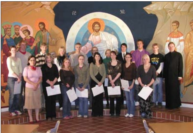
Kuopiossa kevään ortodoksiset ylioppilaat saivat diakoniatoimikunnalta perinteiset lakkirahansa. MONIA VUOSIA!