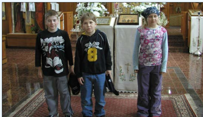
Tuusniemen alakoulu kävi tutustumassa Valamon kirkkoon viime keväänä.

SIRPA OKULOV P 0500 946 601 SIRPA.OKULOV@ORT.FI