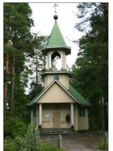
Neitsyt Marian Syntymän kirkko on rakennettu vuosina 1955-56.

(Juhlan kaikki puheet on luettavissa Internetissä osoitteessa: http://www.ortodoksi.net/kuutoset/mikkeli/Pmk_kirkko_50_vuotta.htm )