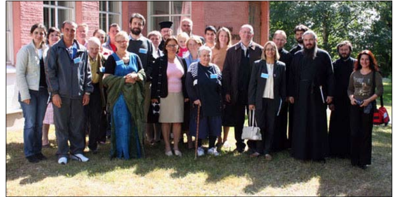
Uskontokasvatuksen asiantuntijat kokoontuivat Valamoon.