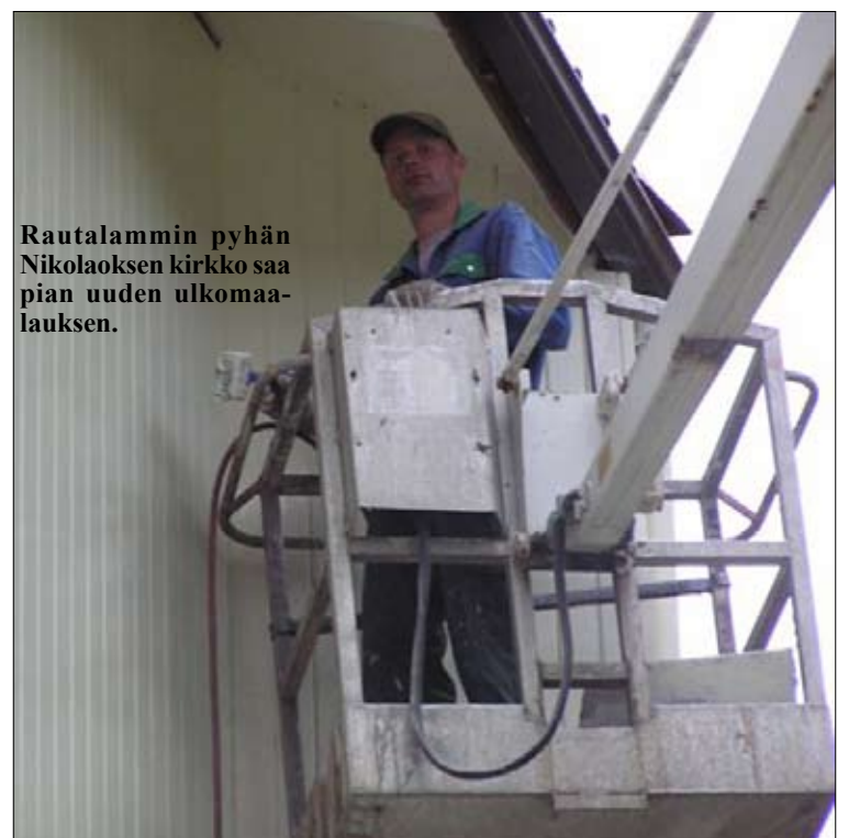
Rautalammin pyhän Nikolaoksen kirkko saa pian uuden ulkomaa-luksen.

TEKSTI: SIRPA OKULOV